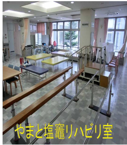
やまと塩竈リハビリ室

ベッドから起き上がる、立ち上がる、歩くなどの基本動作訓練を行い、出来る動作が増えるよう支援します。