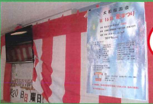
第16回夏祭りの様子 ♪皆さん楽しそうな笑顔でした。。