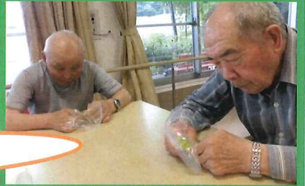
皆でおじゃがすを手作りしました♪