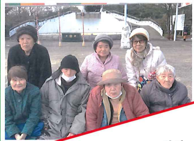
ドライブの思い出 (中山大観音、農業園芸センター、 春日パーキングエリアなど)