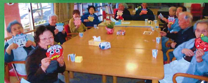
手芸ボランティアで の作品で一す!(^^)!