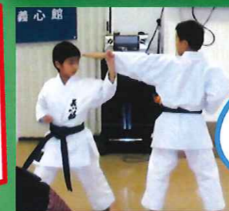
義心館による 空手の演武