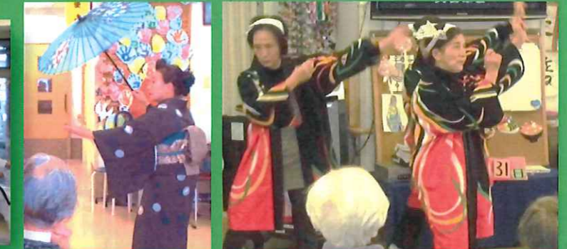
踊りボランティア♪