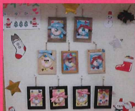
みんなで作った作品の数々♪