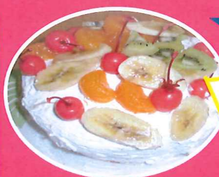
クリスマス会ではケーキを作りました