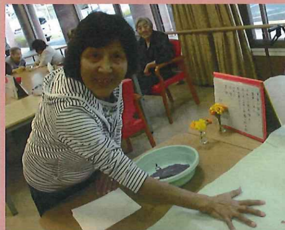
手を大きく開いて、立派な手形を押してくださいね☺