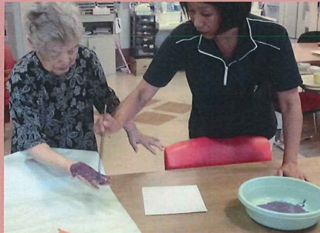
手に絵具を塗って、力いっぱい押し付けます。 大小、様々な葉っぱが出来ました✿