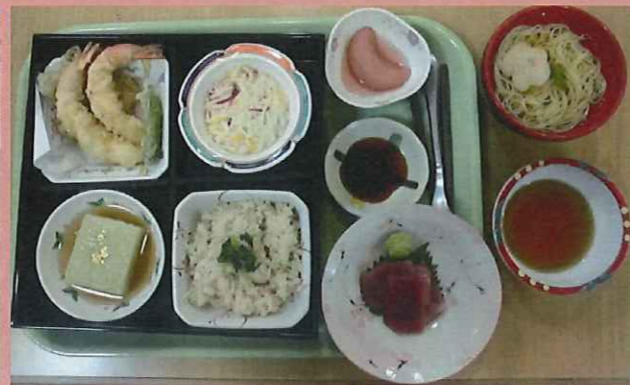
【敬老祝いの松花堂弁当】 ・帆立ご飯や鮭のお造り、天麩羅など 美味しいメニューに皆さま、笑顔で召し上がられておりました。