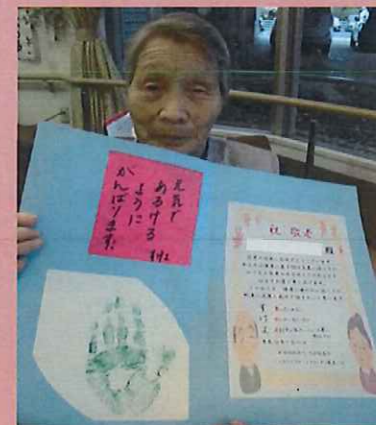
お一人お一人にお名前についたコメントを付けて、皆様にお渡ししました。 「傑作だな」と大変喜ばれていました。