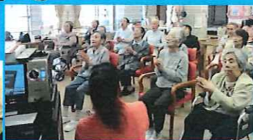
講師の先生の動きに合わせて、皆さん身体をいっぱい動かして体操に取り組まれておりました。