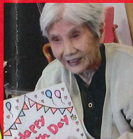
誕生日おめでとうございます