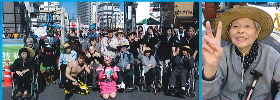
市民まつりでヒーローと記念写真！ 晴天に恵まれました♪