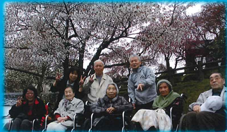
加瀬沼公園でお花見です。満開の桜がきれいでした♪

5月になって暖かくなりましたね。しおいでは様々な行事を 予定しておりますのでお楽しみに～♪