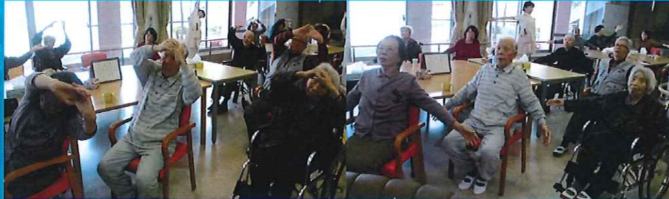
お達者クラブの様子です！懐かしい曲に合わせて体操です。