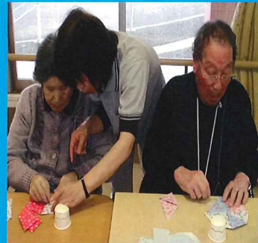
手芸ボランティア！今月は笠を作りました。