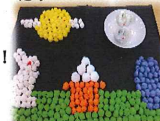
ペーパーを濡らし、丸めて乾燥して作りました!