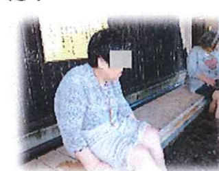
足湯ドライブ、松島温泉にて!