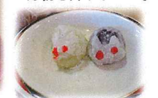
お菓子で作りました!