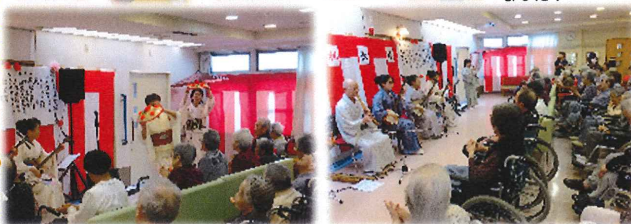
9月の大イベントは、なんといっても「敬老会」です! 当日は利府民謡愛好会様にご協力を頂き盛大に行われました。