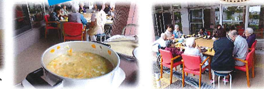
ちょっと芋煮会には早いんですけど、大鍋で旬の野菜をたくさん入れて芋煮を作りました。外で楽しく、おしゃべりをしながらお召し上がりなりました!