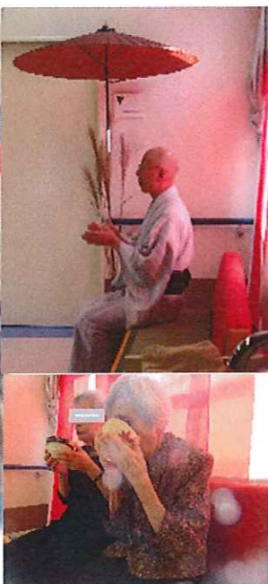
敬老会にお茶をたててご馳走になりました!