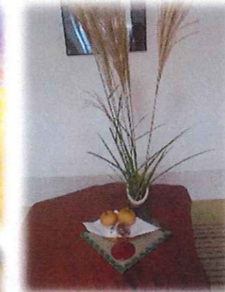
しおりのロビーにて、仲秋の名月様にお供え物を飾りました。