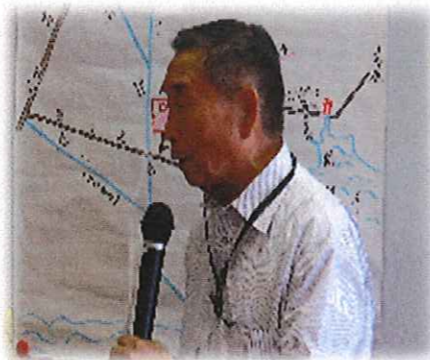
職員による地域の歴史の講話会です