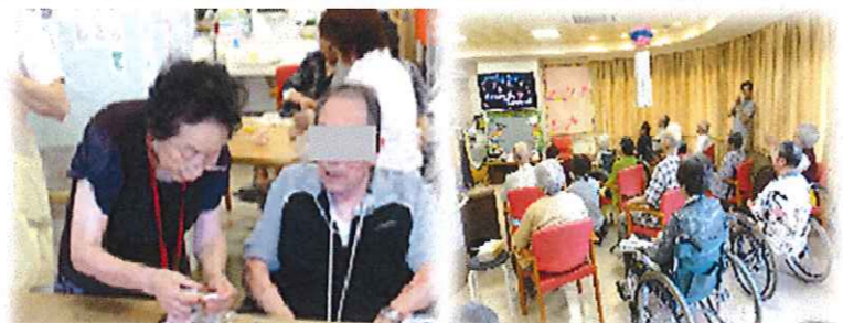
介護支援ボランティア様の協力 でポーチ作り挑戦!

デイ主催の「納涼会」にショートのご利用者様も加わり、魚釣り・射的・スイカ割り・かき氷などをご提供させて頂きました。頑張ったご利用者様には景品をお配りしました!