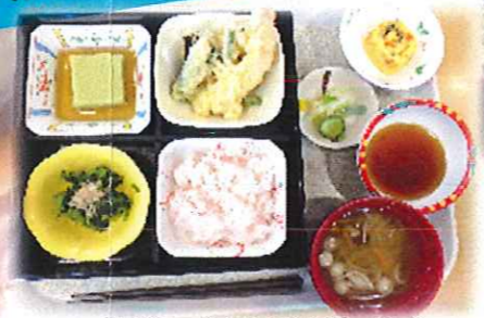
季節の旬を素材にした 自慢のご献立です!