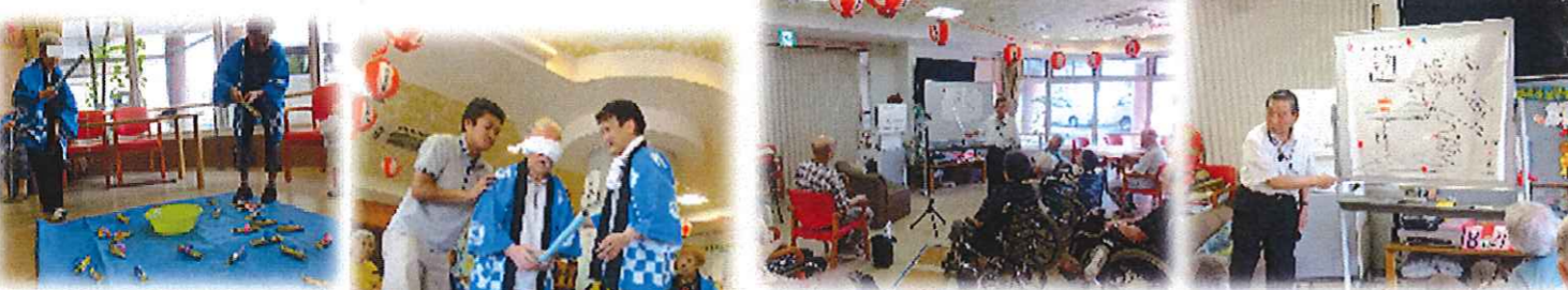
月に一度の職員(地元歴史家)による歴史の講話会です

8月の大イベントは「流しそうめん」です! 特大の孟宗竹を使って流し台を作り、めんつゆの器も竹の節で作りました。外でショート・デイのご利用者様に醍醐味を味わって頂きました。利用者様は、楽しそうにお腹いっぱい召し上がられました!