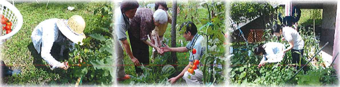
なっば倶楽部で育てた野菜の収穫です。トマト・キュウリ・ナス・ゴーヤ・スイカなどたくさん採れました。採れたての野菜は美味しかったです!