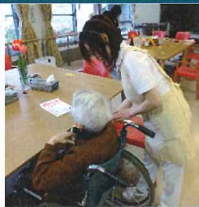
看護師による健康チェック