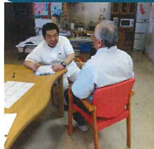
柔整師による機能訓練